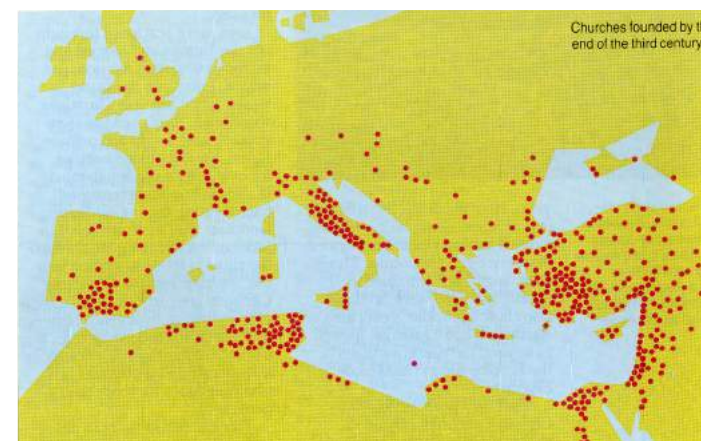
Igrejas do 3º século.