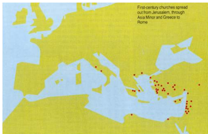
Igrejas do 1o século.